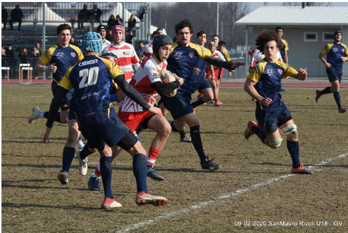
09-02-2020 SanMauro Rivoli U18 - GV